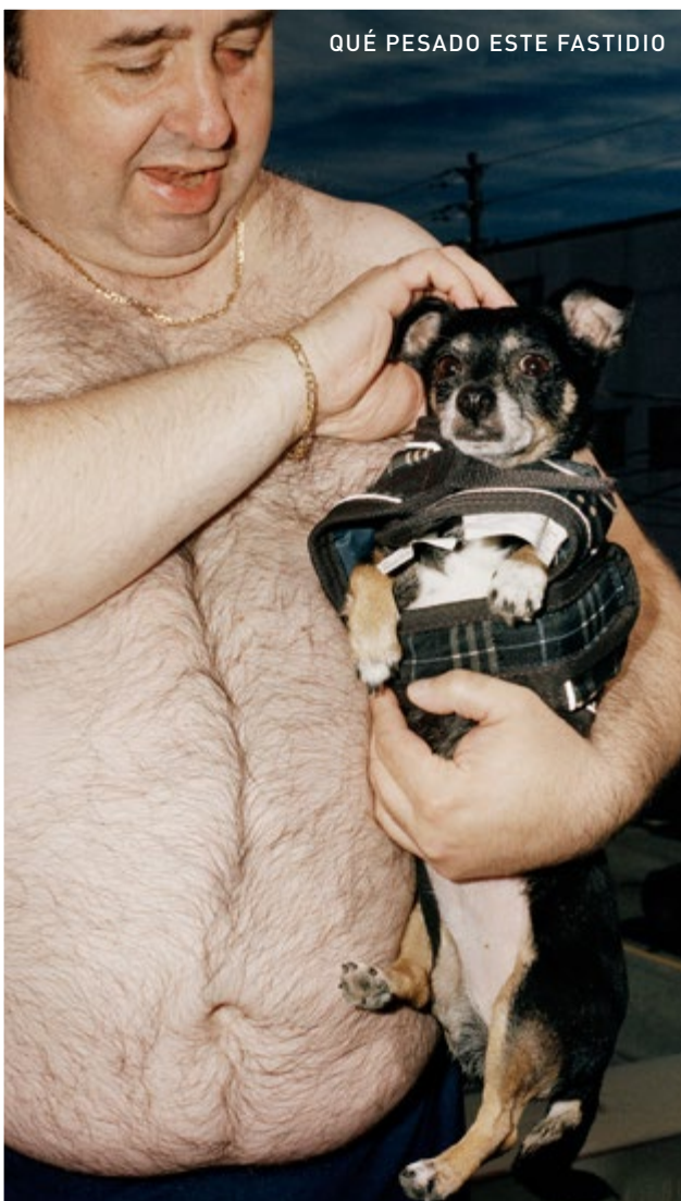
QUÉ PESADO ESTE FASTIDIO

Era el Hotel Cambridge Eliane Caffé, 2016, 99 min, B 20:45