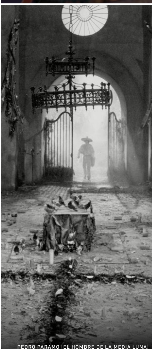
PEDRO PÁRAMO (EL HOMBRE DE LA MEDIA LUNA)