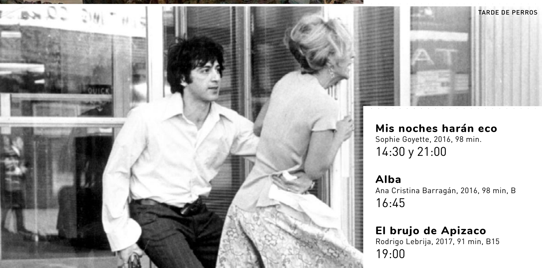
TARDE DE PERROS