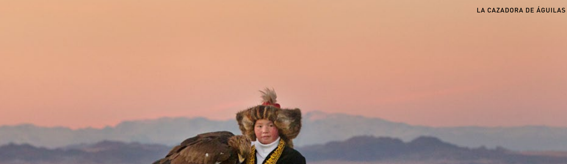
LA CAZADORA DE ÁGUILAS

ACTIVIDADES ACADÉMICAS CHARLA Realizadores de Intensa-mente 18:00 | Participan: Jonas Rivera y Pete Docter | Entrada libre | Cortesías en taquilla 5