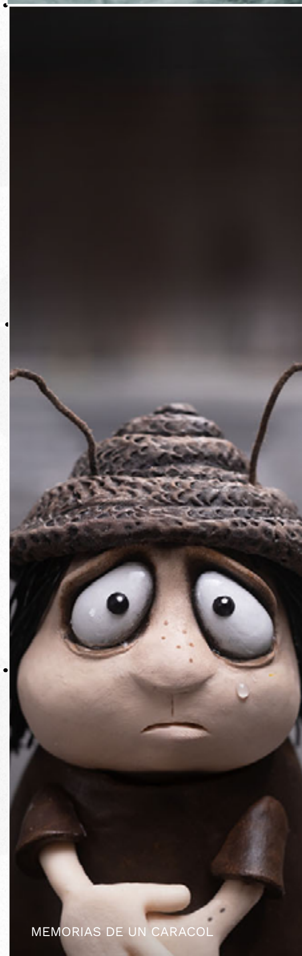
MEMORIAS DE UN CARACOL

CLASIFICACIONES | AA: Comprensible para niños menores de 7 años | A: Todo público | B: Adolescentes de 12 años en adelante | B15: No recomendada para menores de 15 años | C: Adultos de 18 años en adelante | D: Película para adultos