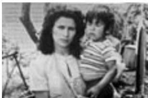
Los motivos de Luz (1985)