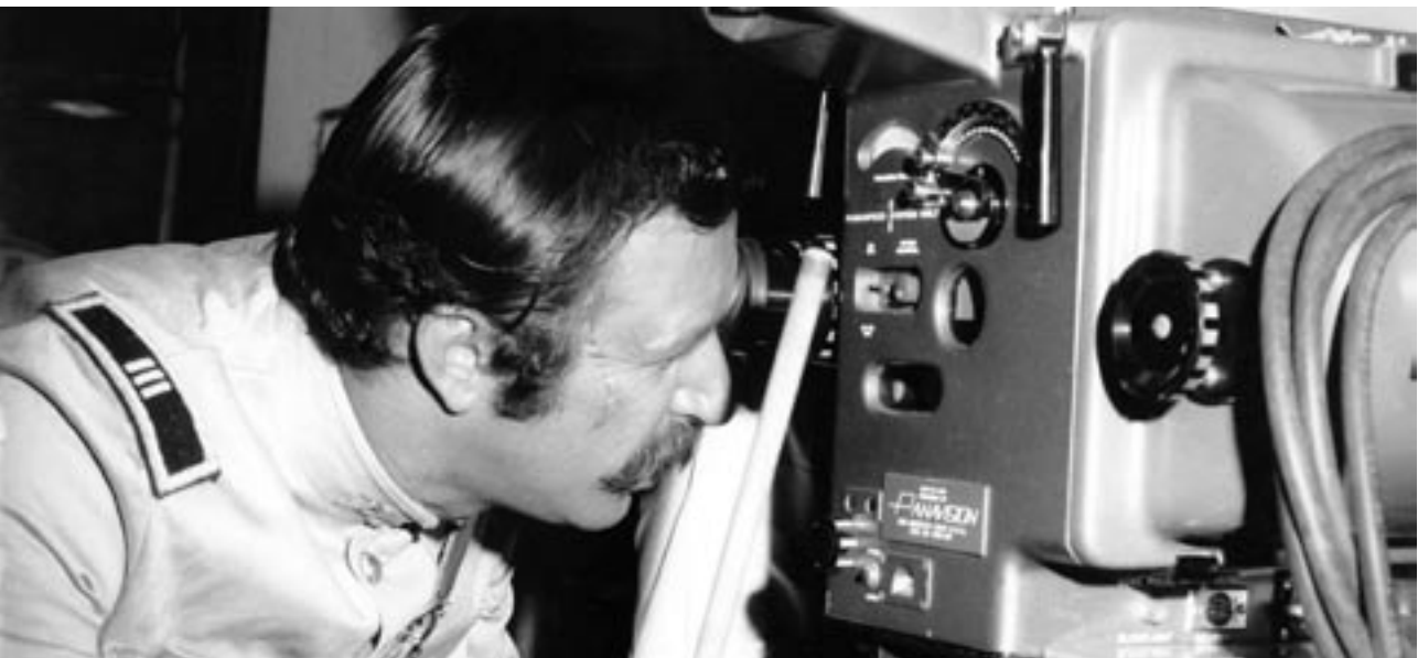
Felipe Cazals en la filmación de Emiliano Zapata (1970)