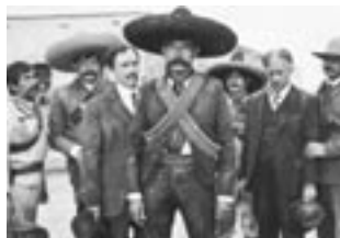
Emiliano Zapata (1970)