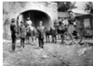
Aquellos años (1972)