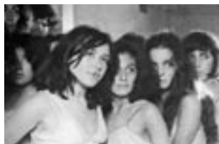
Las Poquianchis (1976)