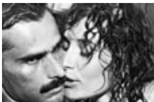
La furia de un dios (1987)