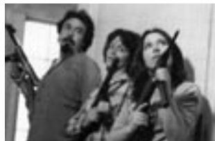
Bajo la metralla (1982)