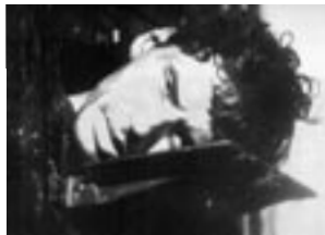
El apando (1975)