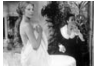
La Güera Rodríguez (1977)