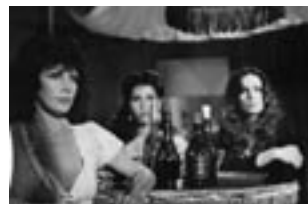
Las siete Cucas (1980)