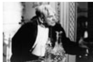
Su Alteza Serenísima (2000)