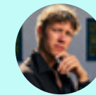
HALFDAN ULLMANN TØNDEL Oslo, Noruega, 1990

2024 Cámara de Oro. Festival de Cannes. Francia. | Premio Jurado Joven Sección Oficial. SEMINCI, Semana Internacional de Cine de Valladolid. España. | Premio a Mejor Película. Festival Internacional de Cine de Hamptons. Nueva York, Estados Unidos. | Premio de la Asociación de Críticos de Cine Griegos. Festival Internacional de Cine de Atenas. Grecia. | Descubrimiento Europeo-Premio FIPRESCI. Premios del Cine Europeo. Academia de Cine Europeo.