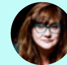
ISABEL COIXET San Adrián de Besós, España, 1960

2023 Concha de Plata al Mejor Actriz (Hovik Keuchkerian) y Premio Feroz Zinemaldia. Festival de San Sebastián. España.