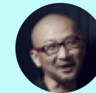
GUAN HU Pekín, China, 1968