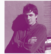
JAMES VAUGHAN SIDNEY, AUSTRALIA, 1989

Ray y Alice, dos veinteañeros australianos de clase media-alta, parecen no tener los pies en la tierra, ya sea en temas amorosos, de trabajo, o incluso en aquello que conciben como divertido. Su actitud insatisfecha, que reluce durante un camping entre las ciudades de Sydney y Melbourne, los lleva a experimentar una serie de extrañas situaciones que son mostradas en divertidas viñetas a través de esta ópera prima de James Vaughan. El resultado es una estimulante exploración del mundo de los jóvenes adultos en Australia, aderezada por el matiz irónico de la generación millennial y las contradicciones estructurales de la historia de un país construido sobre la base del desplazamiento cultural.