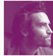
IDA CUÉLLAR BARCELONA, ESPAÑA, 1977

En 1994, el científico mexicano Jacobo Grinberg desapareció de forma misteriosa. Las circunstancias extrañas de su desaparición dieron pie a múltiples hipótesis y teorías que han contribuido a ocultar la verdad del caso. En varios estudios como el que mostró los primeros indicios de la telepatía humana, Grinberg llevó el estudio de la psicofisiología más allá de los límites de la ciencia tradicional con el fin de acercarse al potencial infinito del cerebro humano. Siguiendo diversas pistas, entre ellas las del comandante que investigó el caso, este documental reconstruye los sucesos que explican la ausencia del doctor Grinberg, en un viaje que va por México, Estados Unidos, Nepal y España.